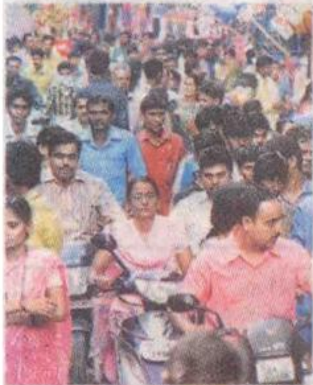
ऐसे बदलेगा शहर

शहर की आबादी 2.4 फीसदी की दर से बढ़ रही है। 2021 तक 13